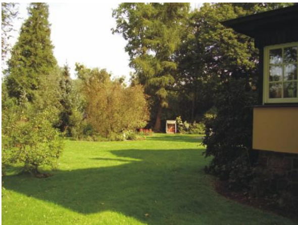
Garten mit Sitzecke